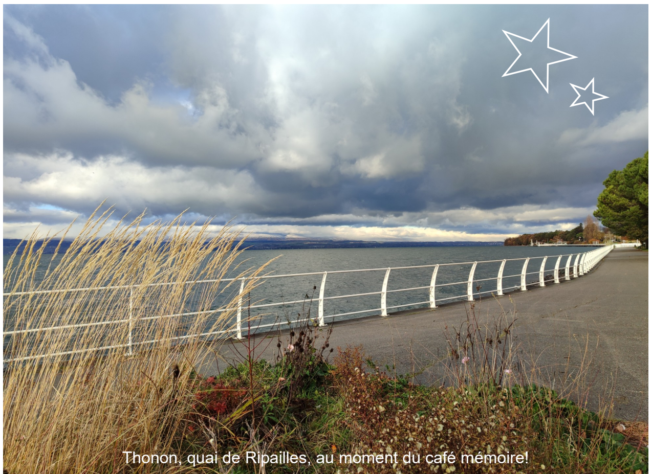
Thonon, quai de Ripailles, au moment du café mémoire!